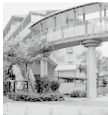
立体遊歩道（住宅敷地内）