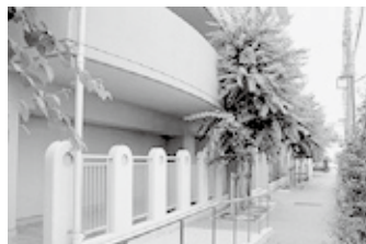
遊歩道（住宅敷地内）