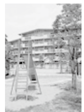
児童遊園（住宅敷地内）